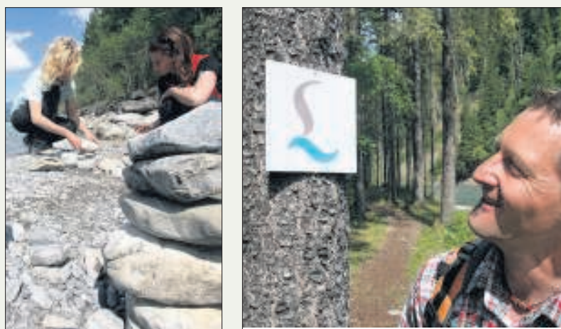
Onderweg: Goed eten en drinken, genoeg tijd voor ontspanning en een duidelijke bewegwijzering: stuk voor stuk sterke punten van deze langeafstandswandeling.

loopt dus van het Oostenrijkse Tirol naar de Duitse Allgäu.