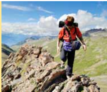
Op de Crête de la Selle (route 61).

Zodra een bergwandelaar het hier op papier geschreven omzet in daden en op pad gaat, doet hij dat op eigen verantwoordelijkheid. Aan de indicaties in dit gidsje van de te verwachten moeilijkheden onderweg kan geen enkel recht ontleend worden. Bergwandelen is een bezigheid die een groot beroep doet op het eigen inschattingsvermogen en de eigen verantwoordelijkheid.