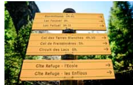
De start van vier routes in de Vallée de Freissinières.

Bij het beoordelen of een traject geschikt is voor kinderen is rekening gehouden met passages waar een val ernstige gevolgen kan hebben. T3-trajecten zijn dus per definitie ongeschikt, maar een enkele keer zelfs T2. De verschillen tussen kinderen zijn echter groot, qua leeftijd en ervaring. Uitgangspunt is de moeilijkheidsgraad en niet de lengte van een tocht. Het spreekt vanzelf dat kinderen vanaf 10/12 jaar de Crête de la Pendine (route 30) kunnen doen. Bij die route staat het pictogrammetje Ongeschikt voor kinderen , maar bij de tip staat dat de wandeling wél geschikt is voor iets oudere kinderen. Het gaat dus nadrukkelijk slechts om een indicatie, die elke ouder moet