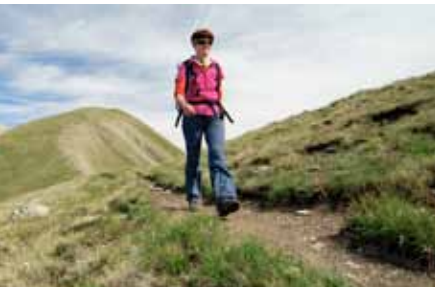
Pic du Gazon.

Bij de routes in deze gids is vermeld of er een top beklommen wordt. Vaak is de berg het doel, soms is de top slechts een onderdeel van een mooie graatwandeling. Alle tochten die een punt bereiken dat als top op de topografische kaarten staat, hebben het predikaat 'beklimming' gekregen, ook al is er een wereld van verschil tussen de eenvoudige (kinder)wandeling naar de Pic du Gazon (route 69) en de veel moeilijkere beklimming van de Peyre Eyraute (route 56).