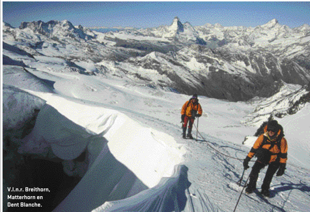
V.l.n.r. Breithorn, Matterhorn en Dent Blanche.

De verse sneeuw en de bergen zien er uit alsof ze met Ariel gewassen zijn