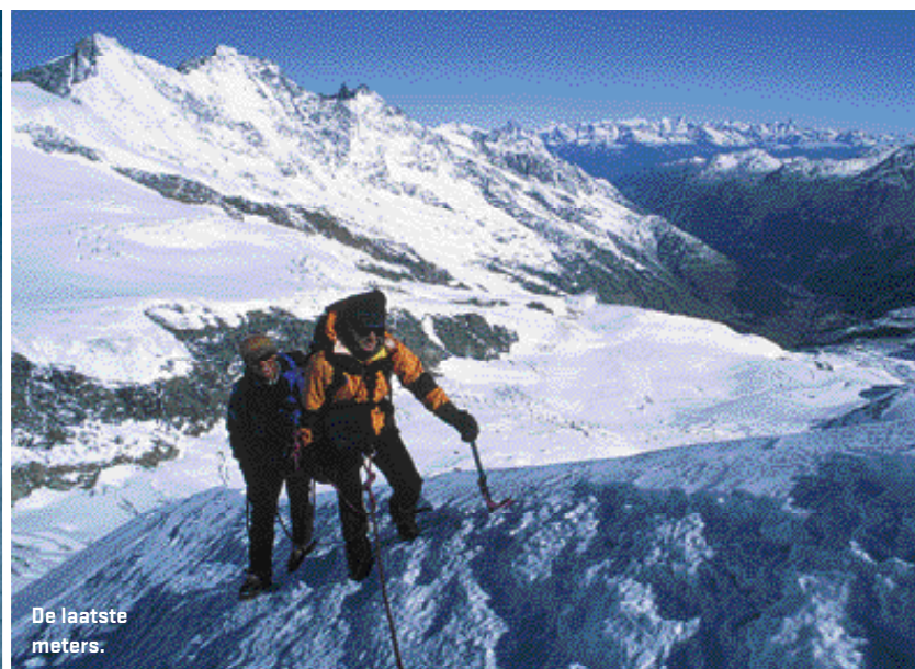
De laatste meters.