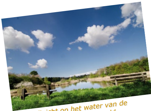
Riant uitzicht op het water van de Stille Vallei in het Horsterwold.

Het Pieper-rondje Zeewolde speelt zich af in de uitgestrekte polders en de aantrekkelijke loofbossen tussen Almere en Zeewolde. Het zijn niet alleen de akkers vol friscgroen aardappelloof en wuivend graan die een rol spelen, maar ook het Eemmeer, gezellige zandstrandjes en de heerlijke, schaduwrijke en windwerende loofbossen van het Hulkesteinse Bos en het Horsterwold. Daar kan de fietser picknicken in het bos, want in de polder doet men niet aan picknicktafels en -banken.