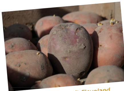
Biologische piepers uit Flevoland.

Oer-Nederlands eten zonder piepers is ondenkbaar. Maar de oorsprong van de pieper ligt in Zuid-Amerika. Dertienduizend jaar geleden werden er voor het eerst aardappelen in het wild gevonden, in de Andes. Samen met maïs vormden piepers het belangrijkste voedsel voor de Inca's. Na de ontdekking van Amerika brachten Spaanse ontdekkingsreizigers veel kostbaarheden mee terug naar Europa, waaronder de aardappel. Vanaf 1570 werd de pieper verbouwd in kloosterhoven en botanische tuinen in Zuid-Spanje. Tijdens de Tachtigjarige Oorlog, rond 1600, arriveerde de aardappel in Nederland. De Vlaamse botanist Carolus Clusius werd aangesteld als hoogleraar in Leiden en plantte aardappelen in de botanische tuin van de universiteit. Al snel werd de plant in heel Nederland bekend, eerst als sierplant en medicijn. Pas in de 18e eeuw kwam men er bij toeval achter dat de knol eetbaar is. De pieper werd daarna in grote hoeveelheden ingeslagen voor lange zee-reizen, want vanwege het hoge vitamine C-gehalte beschermdde hij zeelieden tegen scheurbuik.