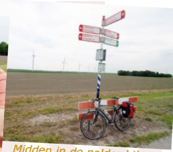
Midden in de polder bij knooppunt 36.