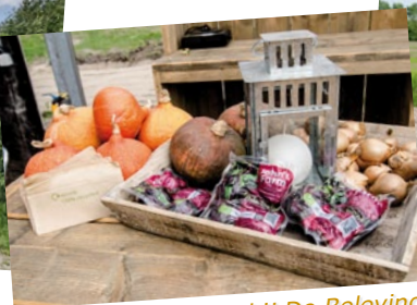
John's Farm-bieten bij De Beleving.