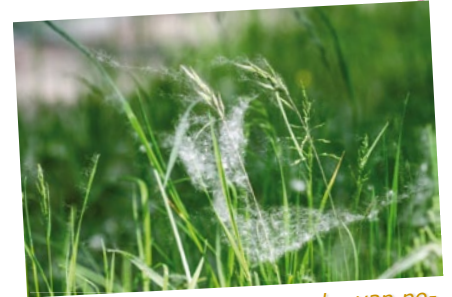
De witte pluïsjes – het zaad – van populieren lijkt op sneeuw in de zomer.