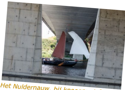
Het Nulder nauw, bij knooppunt 66.