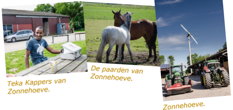
Teka Kappers van Zonnehoeve.

Kortom, Zonnehoeve is een bedrijf vol moderne ambities, waar je als fietser een kijkje kunt nemen, melk kunt tappen uit de melktap en – heel ouderwets – bij voldoende aanbod groente kunt kopen bij een stalletje aan de weg.